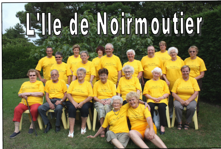
L'île de Noirmoutier

Comme chaque année, la Ville de Tomblaine et le Centre Communal d'Action Sociale ont organisé des vacances à destination des retraités Tomblainois. Noirmoutier, Lacanau, Bussang : 3 destinations différentes pour 3 séjours riches en partage et convivialité.